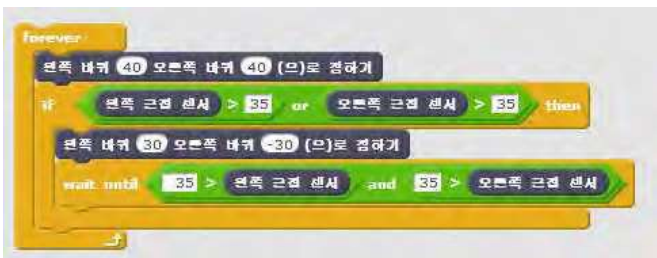
(그림 1) 스크래치 기반 햄스터 로봇 제어 프로그램 예제

햄스터로봇은 다른 교육용 프로그래밍 언어인 스크래치와 파이썬으로 작성한 프로그램을 통해 제어할 수 있다. 아래(그림1)는 스크래치 프로그램으로 햄스터로봇이 장애물을 만나면 오른쪽으로 회전하게 하여 미로를 탈출하게 하도록 작성한 예제이다.