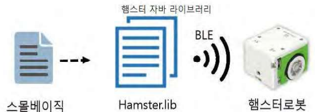
(그림 3) 햄스터 로봇 구성도

(그림3)은 햄스터 로봇 제어를 위한 스몰베이직 라이브러리의 구성을 보여준다. 스몰베이직 프로그램은 자바로 작성한 스몰베이직 라이브러리 Hamster를 이용해 햄스터 로봇 제어 스몰베이직 프로그램을 작성한다. 이 라이브러리는 [3]에서 제공한 자바로 작성된 라이브러리를 기반으로 작성하였다. 스몰베이직 라이브러리 Hamster는 (표1)과 같은 함수들을 제공한다. 스몰베이직 프로그램과 햄스터 로봇은 BLE(Bluetooth Low Energy) 방식으로 통신하는데, 복잡한 연결 과정은 모두 추상화하여 스몰베이직 프로그래머는 쉽게 햄스터 로봇에 연결하고 제어할 수 있도록 라이브러리를 설계하였다.